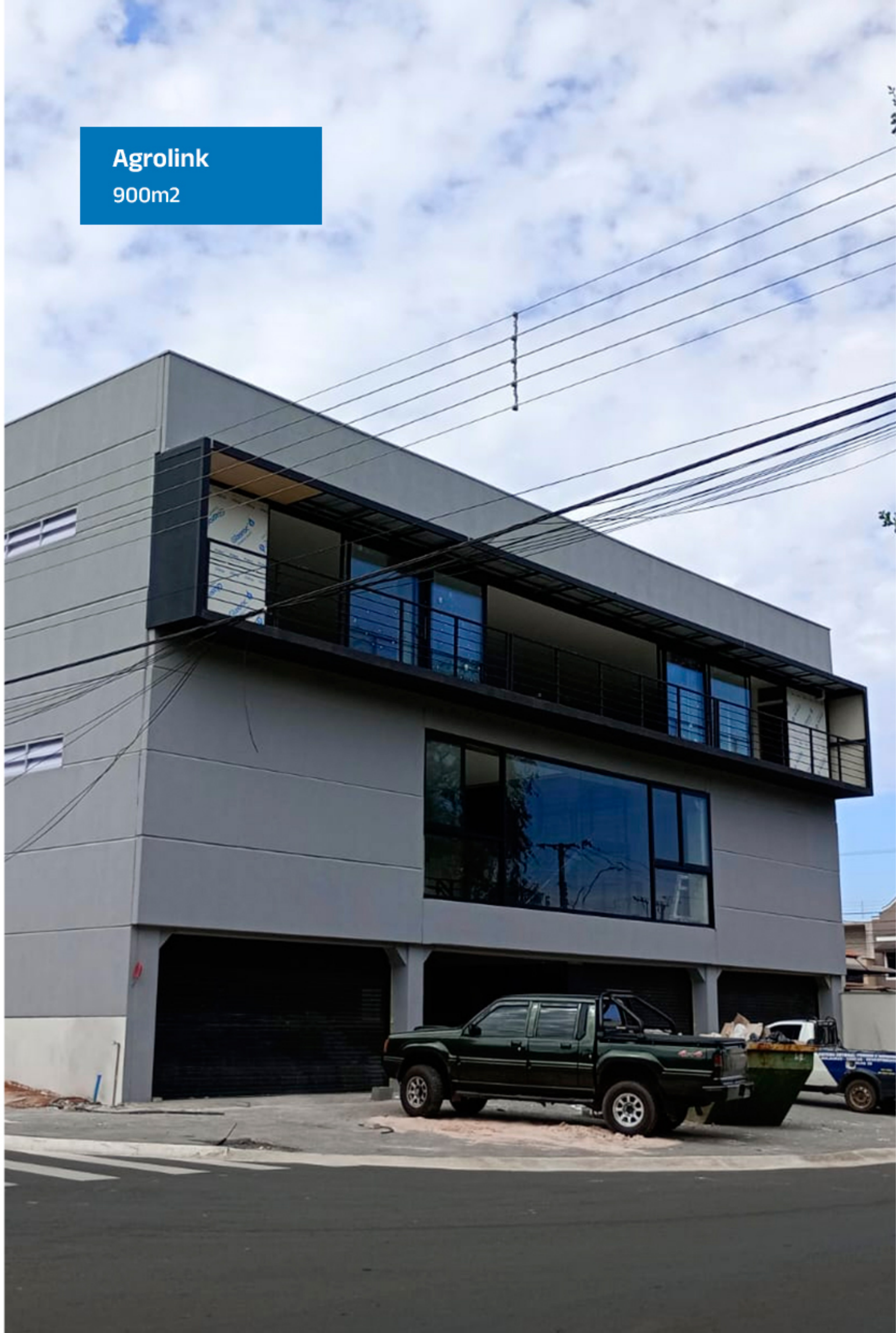
Agrolink 900m 2