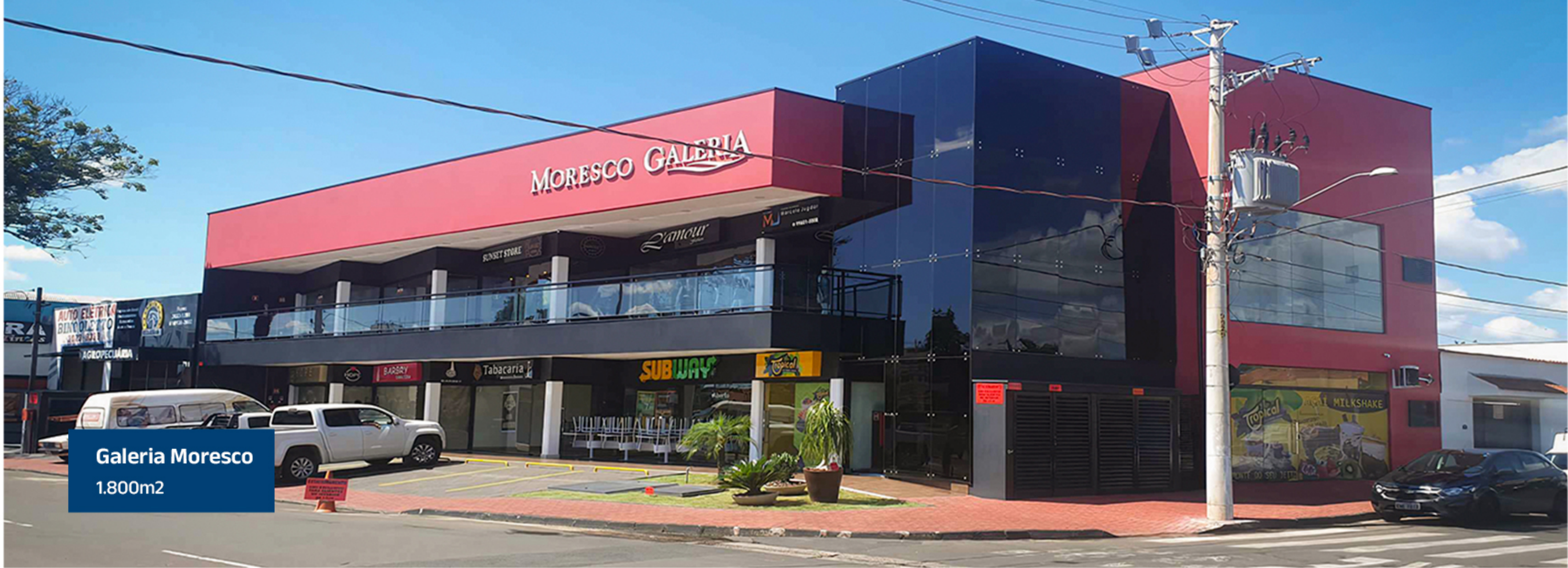
Galeria Moresco 1.800m 2