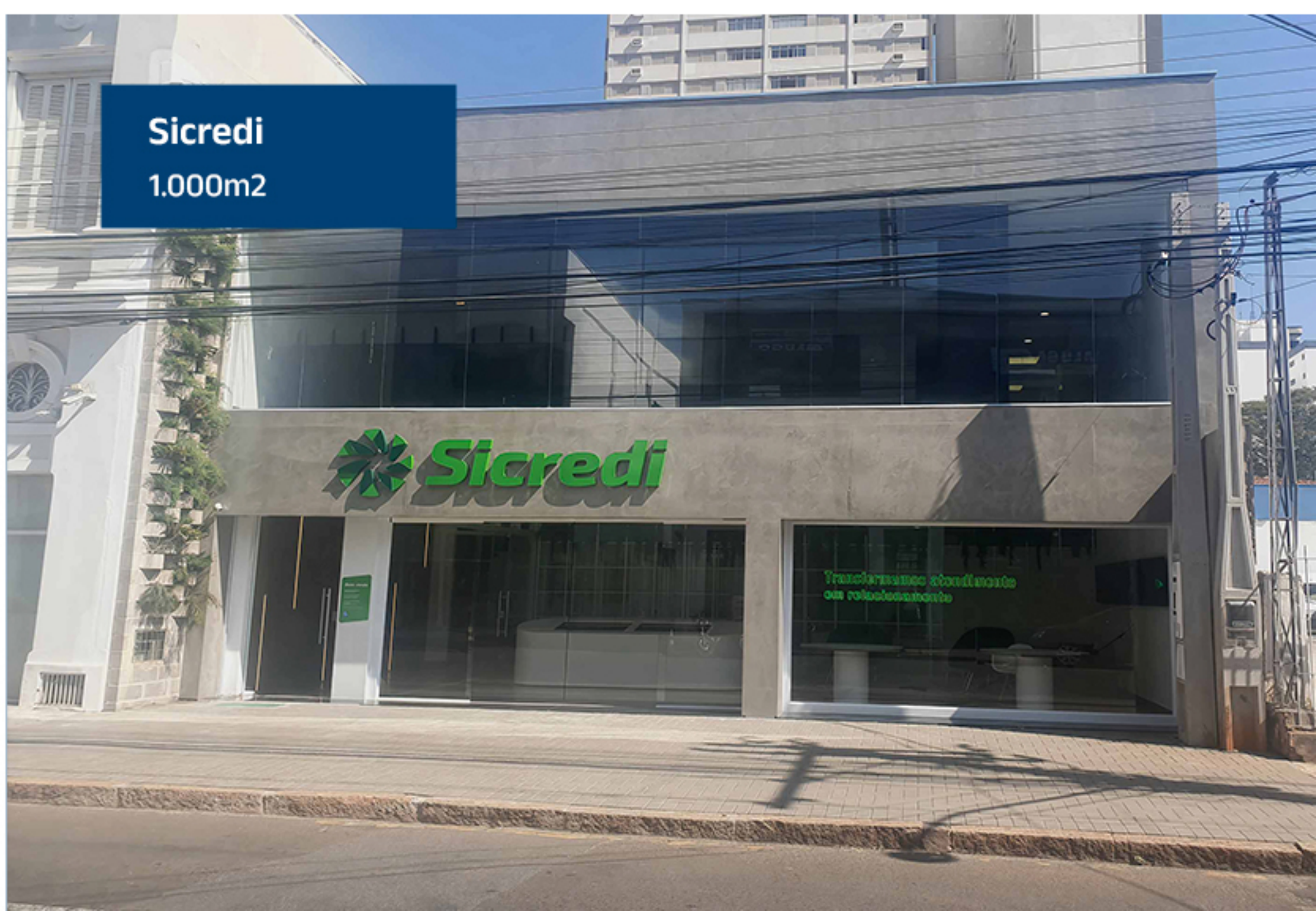
Sicredi 1.000m 2