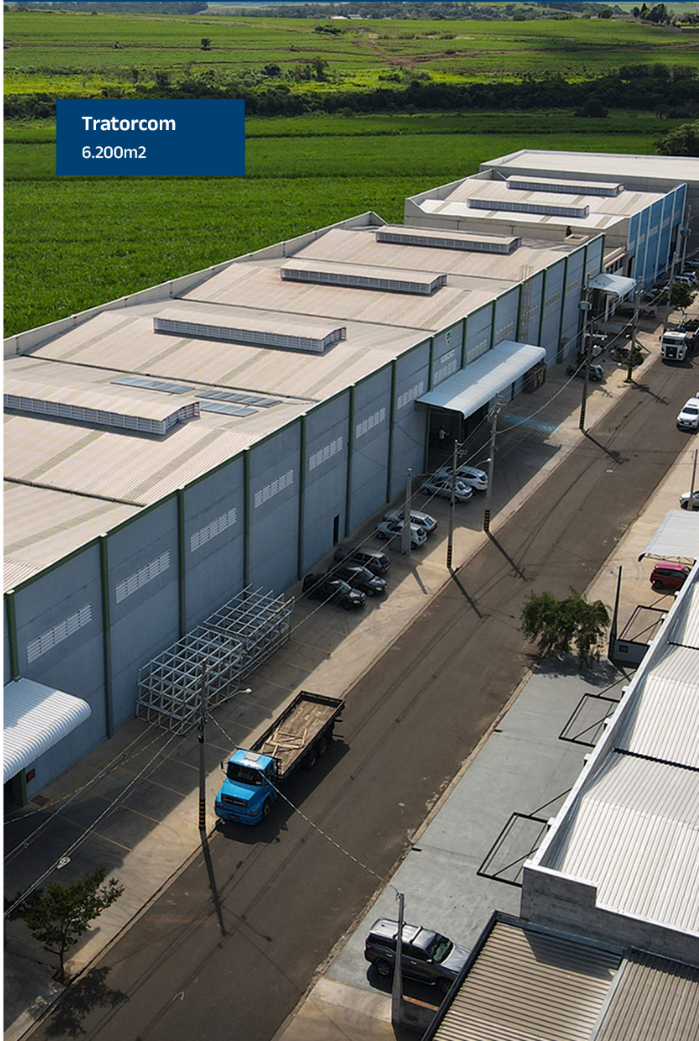
Tratorcom 6.200m 2