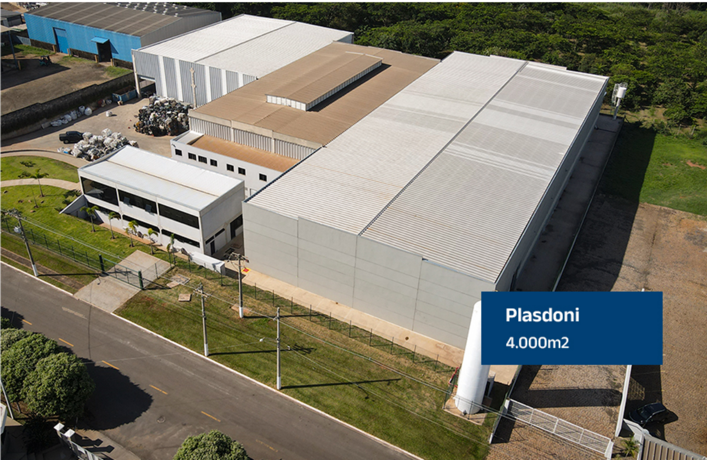
Plasdoni 4.000m 2